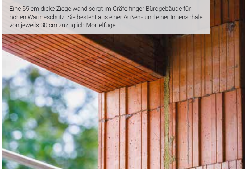
Eine 65 cm dicke Ziegelwand sorgt im Gräfelfinger Bürogebäude für hohen Wärmeschutz. Sie besteht aus einer Außen- und einer Innenschale von jeweils 30 cm zuzüglich Mörtelfuge.

bäudes mit dem kennzeichnenden Namen ‚Bürohaus 2226‘ nach der einzuhaltenden Raumtemperatur von 22 bis 26 °C weckte beim Bauherrn großes Interesse“, schildert der Architekt dessen begeisterte Reaktion. Für die Planung des Projekts der Nabholz KG wurde eng mit Herrn Dr. Widerin zusammengearbeitet, der das Konzept 2226 maßgeblich mitentwickelte. So konnte man von seinen Erfahrungen profitieren.