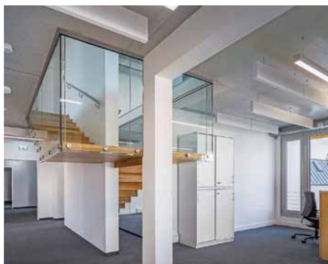
Die nutzbare Bürofläche verteilt sich auf insgesamt neun Büroeinheiten, die in Größe und Zuschnitt der einzelnen Räumlichkeiten variieren und so unterschiedliche Nutzeransprüche erfüllen.