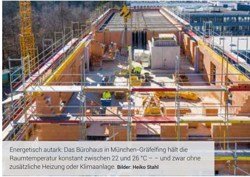
Energetisch autark: Das Bürohaus in München-Gräfelfing hält die Raumtemperatur konstant zwischen 22 und 26 °C – und zwar ohne zusätzliche Heizung oder Klimaanlage.